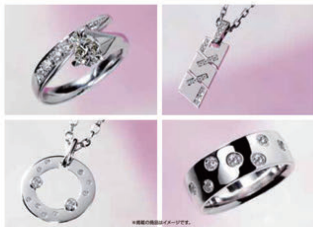
※掲載の商品はイメージです。