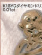
K18YG ダイヤモンドリング 0.01ct