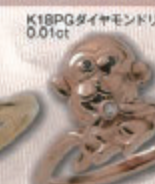
K18PG ダイヤモンドリング 0.01ct