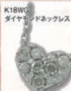
K18WG ダイヤモンドネックレス