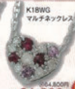
K18WG マルチネックレス